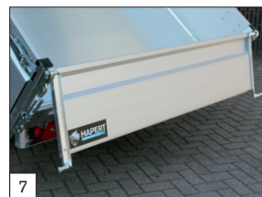
Option : pack « de charge » avec suspension parabolique.