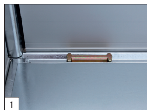
De série : équipée de supports d'arrimage certifiés TÜV avec une capacité de 1 000 daN.