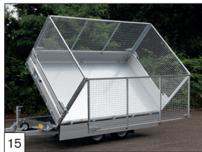
Option : bâche montée et couleur bleu (couleur grise est en série).