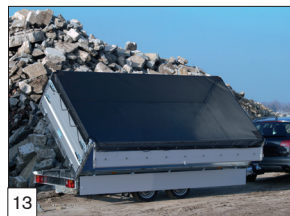
Option : rehausse grillagée amovible de 70 cm de haut et structures grillagées à partir de 3 35 cm, renforcées avec des montants latéraux.