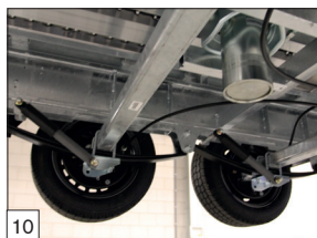
Option : rehausse en aluminium amovibles de 30 ou 40 cm de hauteur.