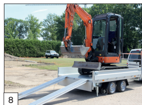
Option : suspension parabolique avec amortisseurs sur les essieux.