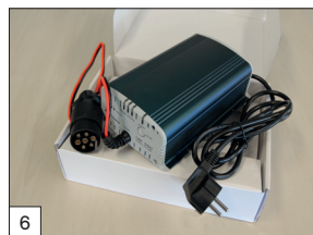
Option : pack « de charge » : 2 rampes en aluminium intégrées sous le plancher et 2 béquilles stables réglables avec manivelle.