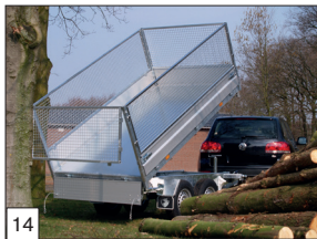
Option : rehausse grillagée de 100 cm de hauteur pour les modèles en 3 05 x 1 80 et 3 35 x 1 80 cm.