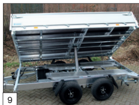
De série : dans les modèles avec suspension parabolique, les pneus sont montés avec des jantes noires.