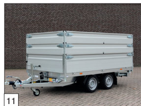
Option : rehausse en aluminium de 70 cm de hauteur, mobiles.