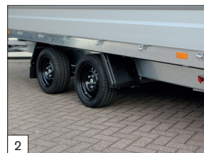
De série : commande électrique avec batterie placée dans un boîtier de protection en acier avec couvercle en plastique.