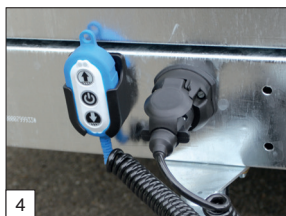
De série : chargeur de batterie (fourni mais non monté).