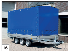
Option : bâche montée et couleur bleu (couleur grise est en série).