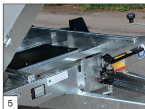
Option : protection des feux arrière, avec ridelle arrière articulée vers le haut et vers le bas (uniquement possible avec des ridelles de 40 cm de hauteur).