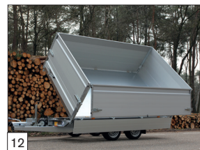
Option : rehausse mobiles avec filet d'arrimage en fines mailles (monté).